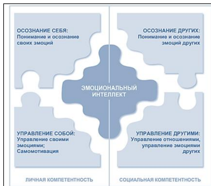
Схема 1. Модель эмоционального интеллекта Д.Гоулмана

Два сектора «Осознание себя» и «Управление собой» составляют личную компетентность, а другие два сектора «Осознание других» и «Управление другими» составляют социальную компетентность (Схема 1).